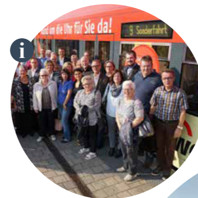
Sonderfahrt der Arbeiterwohlfahrt

Mit der Saarbahn-Facebook-Seite stehen Ihnen aktuell über 8.500 Fans zur Verfügung, die Sie gerne für Ihre Kampagne begeistern dürfen.