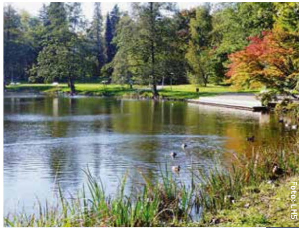
Deutschmühlenweiher im Deutsch-Französischen Garten 1

Dies bedeutet jedoch nicht, dass bei jeder Fahrt auf dieser Linie ein direkter Anschluss an die Umsteigelinie besteht. Es wird lediglich darauf hingewiesen, dass die betreffende Linie und die Umsteigelinie hier eine/n gemeinsame Haltestelle bzw. Haltestellenbereich haben.