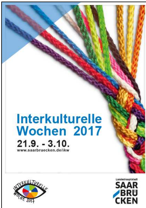
Plakat: Landeshauptstadt Saarbrücken/MuK Motiv: Ökumenischer Rat

30 Veranstaltungen setzten ein Zeichen dafür, dass kulturelle Unterschiede eine Bereicherung für Saarbrücken sind, jedoch Vielfalt nicht immer konfliktfrei ist.