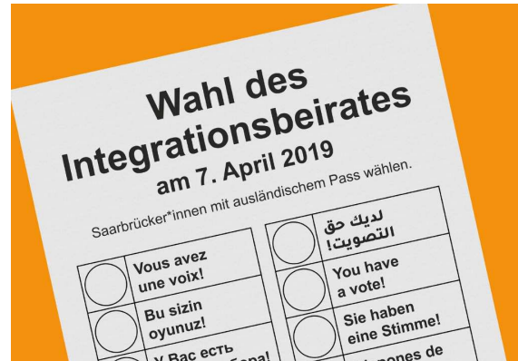
Plakat: Christian Bart

Saarbrücken ihre Hauptwohnung haben. 2019 haben sich nur die Liste Haus Afrika und ein Einzelkandidat zur Wahl gestellt. Die Wahlbeteiligung lag bei 2,1 Prozent. Dies stellt einen nochmaligen Rückgang gegenüber 2009 um 5,5 Prozentpunkte dar.