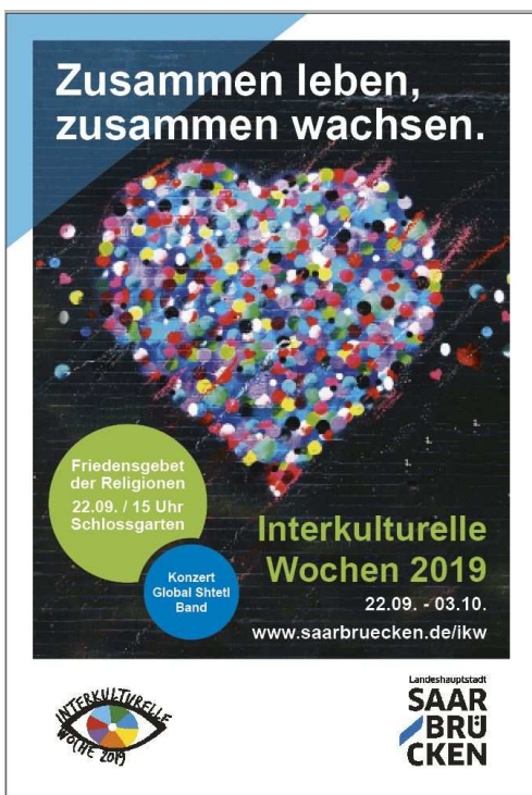
Plakat: Landeshauptstadt Saarbrücken/MuK Motiv: Ökumenischer Rat

Eine pädagogische Fachtagung „Menschenrechtsbildung heute“, initiiert vom Adolf-Bender-Zentrum, bot Praxisansätze, Austausch und Vernetzung für professionelle Akteure und ehrenamtliche Multiplikator*innen.