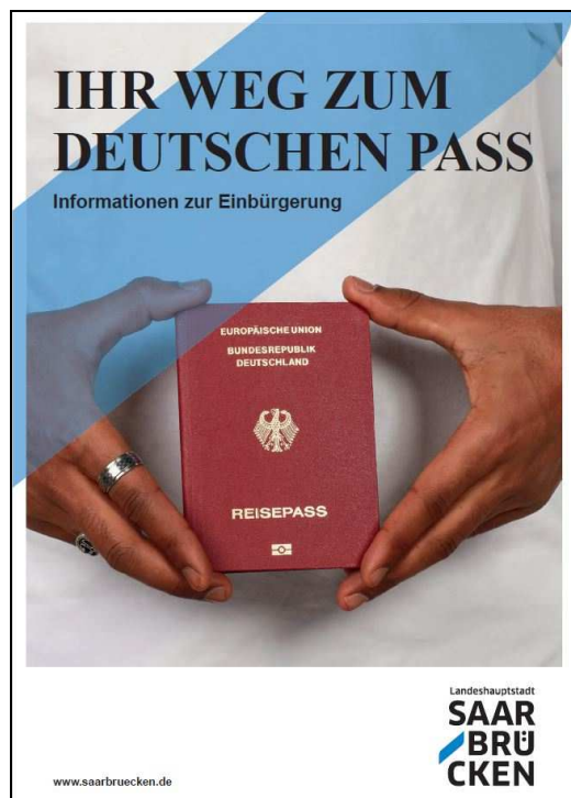
Broschüre: Landeshauptstadt Saarbrücken/MuK

Die Einbürgerungsbroschüre und der Flyer über die Arbeit des ZIB sind 2019 aktualisiert worden.