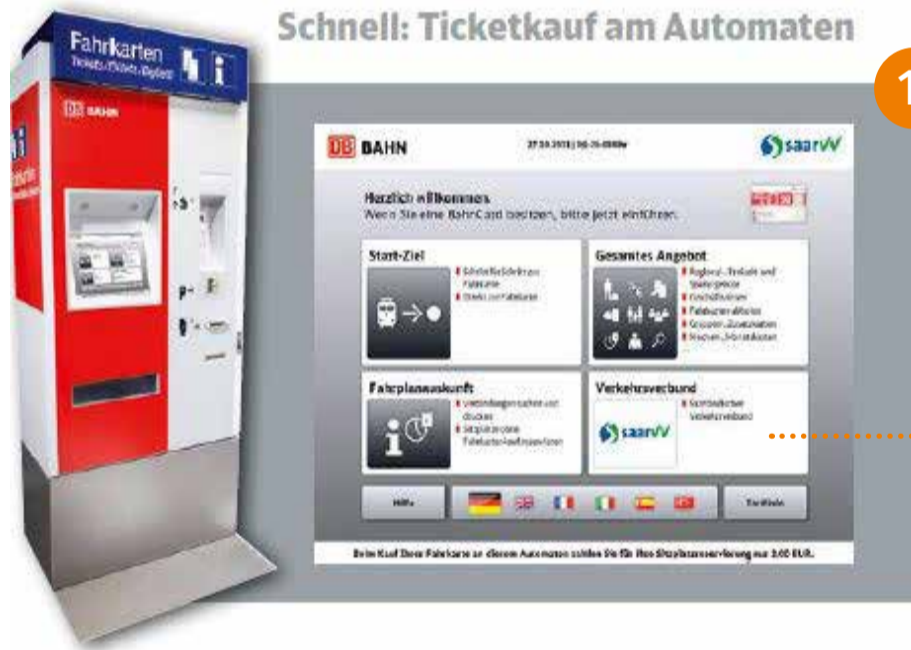
Schnell: Ticketkauf am Automaten