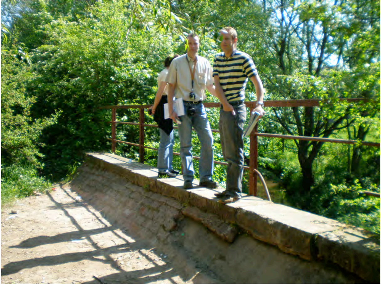
Bild 10: Alte Brücke zwischen Heusweiler Markt und In der Hommersbach