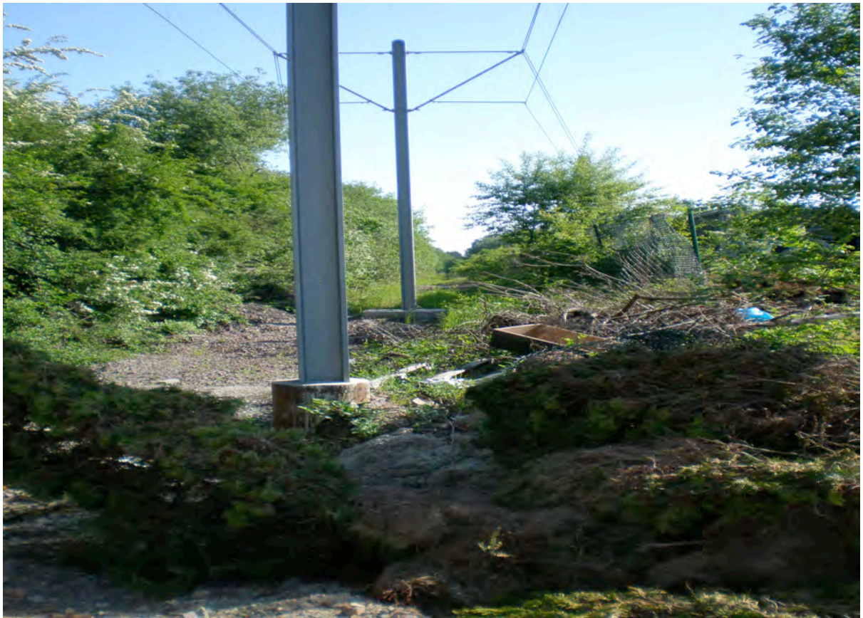
Bild 2: derzeitiges Bauende in Etzenhofen, Richtung Heusweiler gesehen