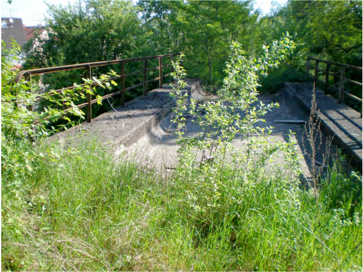
Bild 4: Brücke Walpershofen – geplant ist eine neue 50m lange Brücke