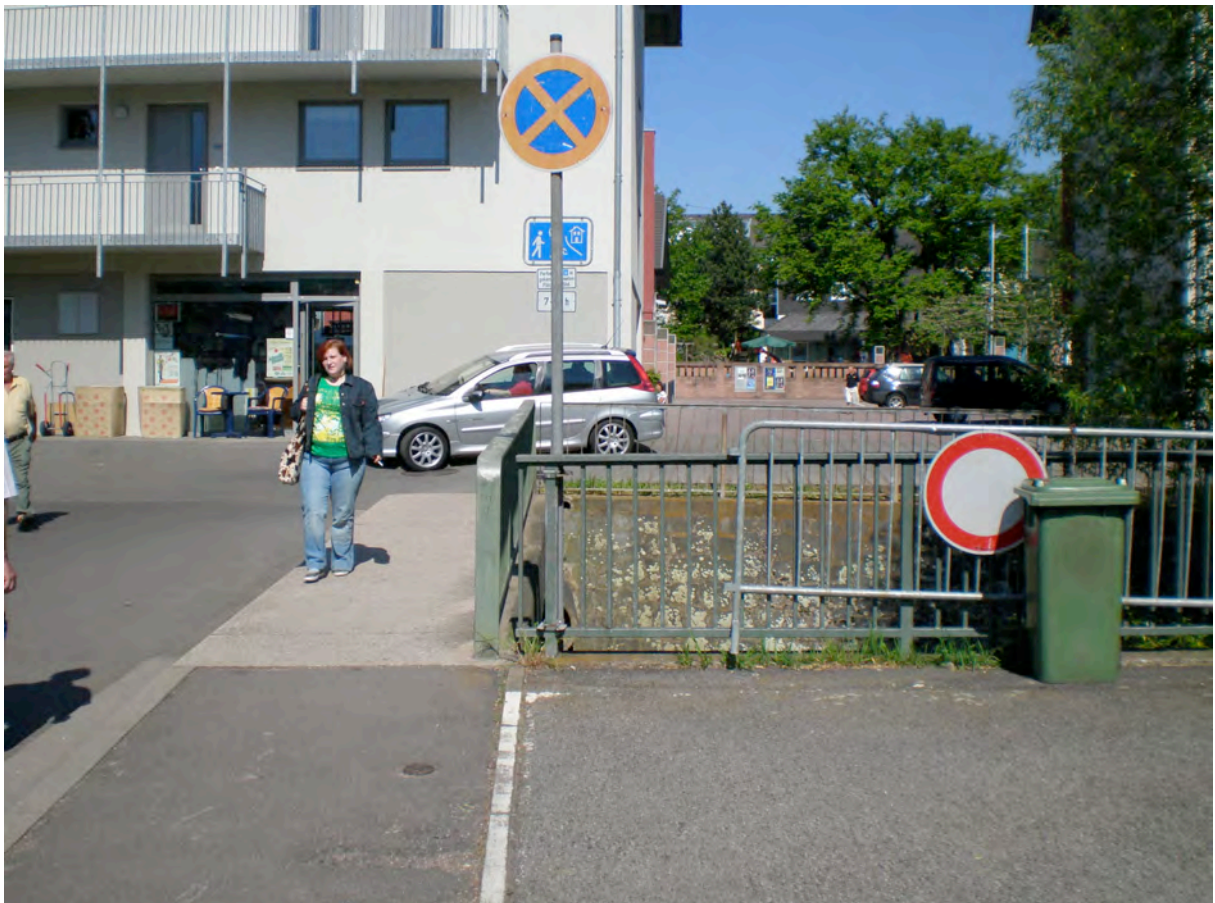
Bild 9: Heusweiler Markt – geplant ist der Neubau der vorh. Straßenbrücke