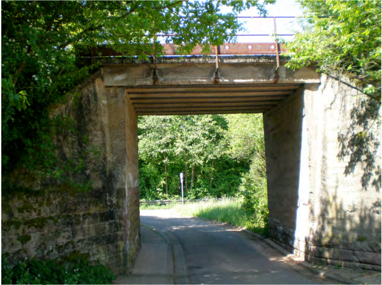
Bild 12: Überführungsbauwerk Winterscheidter Straße – wird saniert