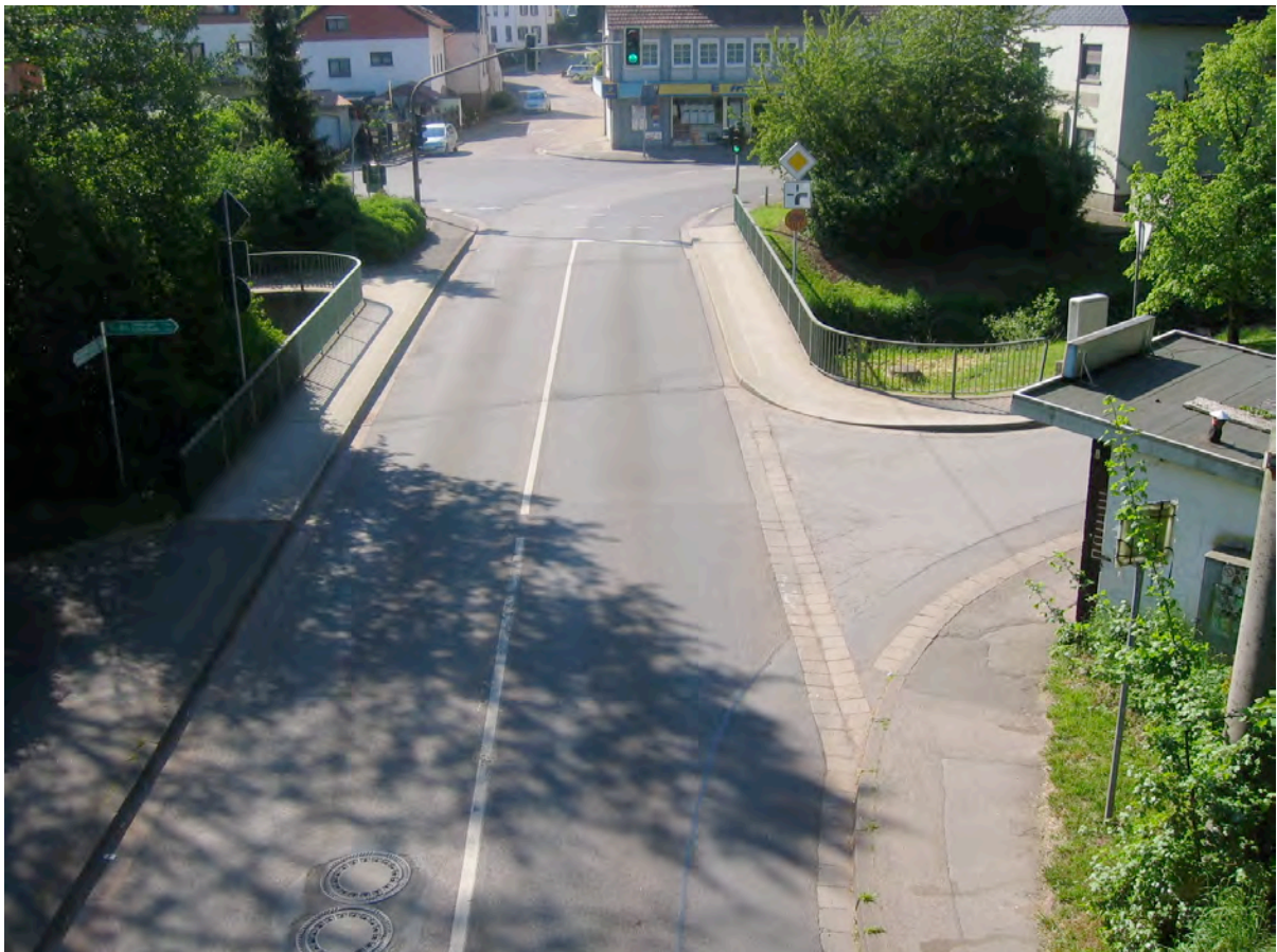
Bild 5: Brücke Walpershofen – Blick auf L 136 Bereich neuer Kreisverkehr