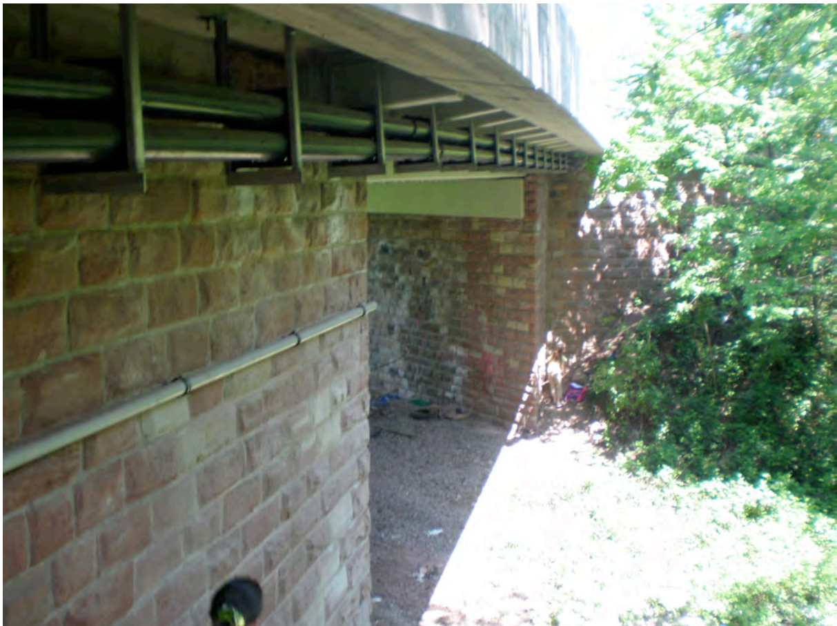
Bild 19: Unterföhrungsbauwerk in Eiweiler – bereits durch den LfS saniert