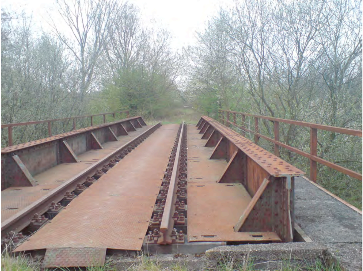
Bild 6: Brückenbauwerk in Walpershofen, nach HAST Walpershofen Mühlenstraße