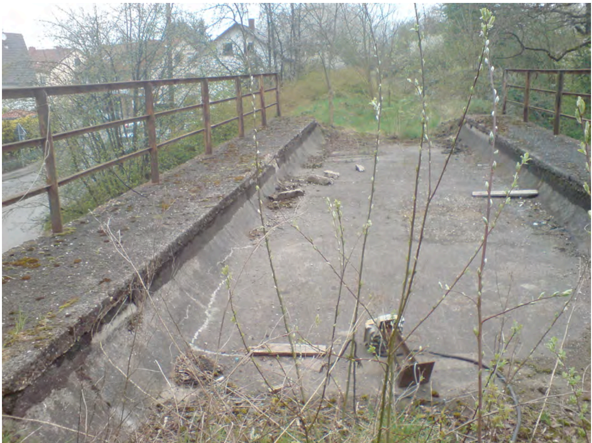
Bild 3: Brücke Walpershofen – geplant ist eine neue 50m lange Brücke