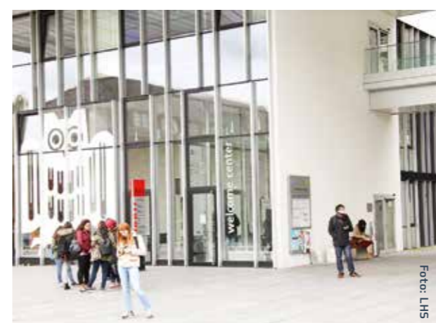
Universität des Saarlandes, Campus