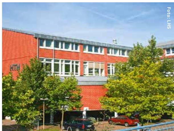
Hochschule für Technik und Wirtschaft