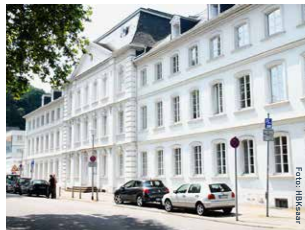
Hochschule der Bildenden Künste Saar