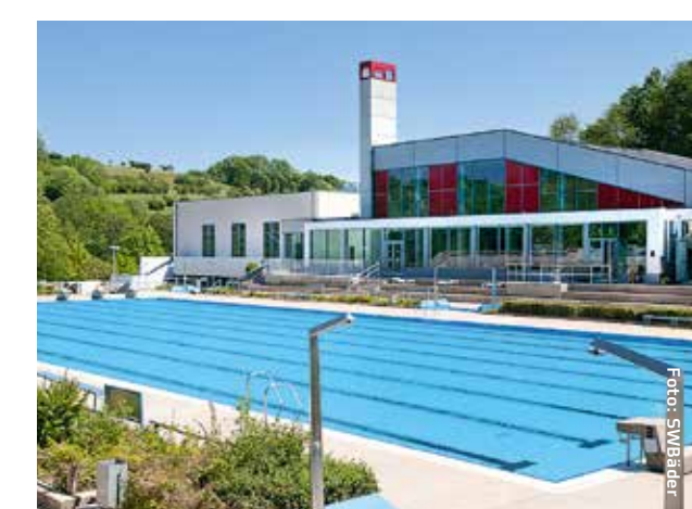
Schwimmbad Fechingen 2