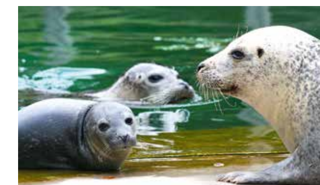
Saarbrücker Zoo 1