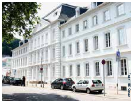
Hochschule der Bildenden Künste Saar