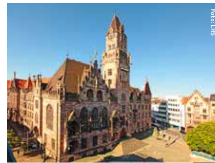
Rathaus St. Johann