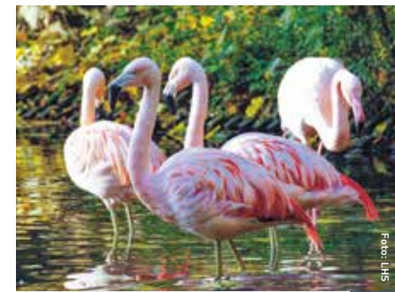
Flamingos im Saarbrücker Zoo