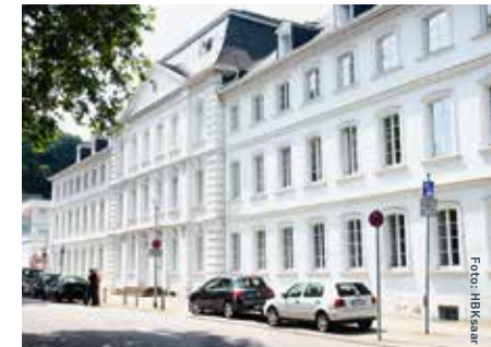
Hochschule der Bildenden Künste Saar