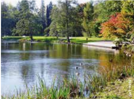
Deutschmühlenweiher im Deutsch-Französischen Garten